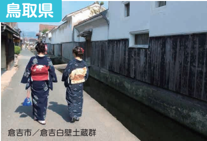
倉吉市 / 倉吉白壁土蔵群

ゆったり、うっとり、ほっこり、鳥取。暮らしの楽しみ方は十人十色。あなただけの移住物語、一緒に作ってみませんか？