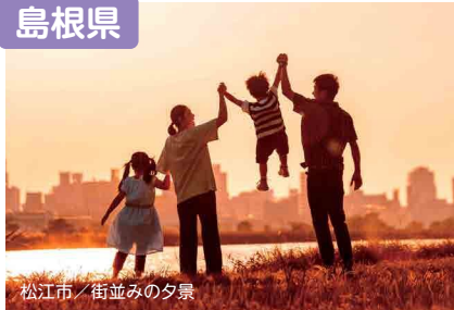
松江市 / 街並みの夕景

人とのつながり、穏やかな時間が“自分らしい明日”を後押ししてくれます。働きやすく、暮らしやすい「島根」を選んでみませんか。