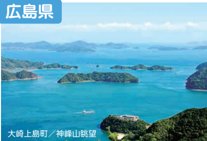
大崎上島町 / 神峰山眺望

広島県には、海・山・川の豊かな自然やそれに隣接する高い都市機能があります。広島県は、チャレンジする人や、夢を見る人を全力で応援します!!