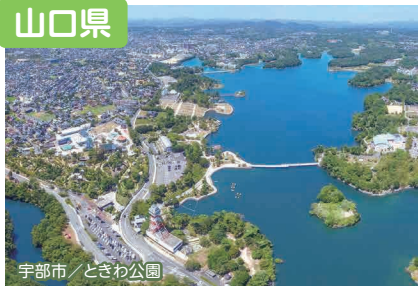
宇都市 / とさむ公園

日本海、瀬戸内海に面し、豊かな自然に恵まれ、都市部にもアクセスしやすい山口県。「意外にいいかも」と思える魅力が詰まっています!