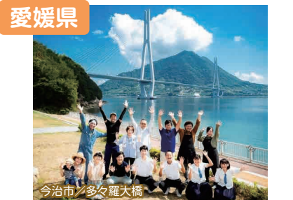
今治市 / 多々羅大橋

せとうちの温暖な気候、自然豊かな島々、ちょうどいい街。人も風土もあつたかい愛媛であなたらしいえひめ暮らしを見つけてみませんか。待ってるけん。