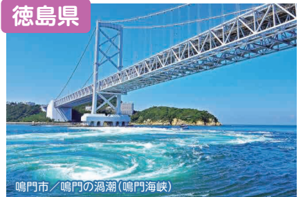
鳴門市 / 鳴門の渦潮(鳴門海峡)

豊かな自然を満喫しながら、良好なテレワーク環境が整っているとくしまで、自分らしいライフスタイルを見つけてみませんか?