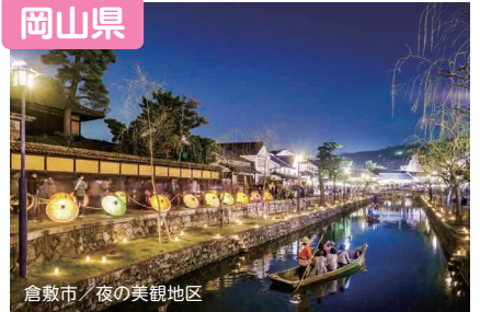
倉敷市 / 夜の美観地区

海や里山、城下町ぐらしなど様々な暮らしが選べる岡山県。地震等の自然災害が少なく、交通網も充実した「晴れの国」であなたにぴったりの暮らしを見つけてみませんか。