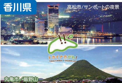
高松市 / サンポートの夜景