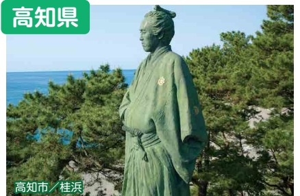
高知市 / 桂浜

高知の魅力は、新鮮で美味しい食べもの、ダイナミックな自然! そして何より、あつたかい人! 「みんなあも、高知家の家族にならん?」